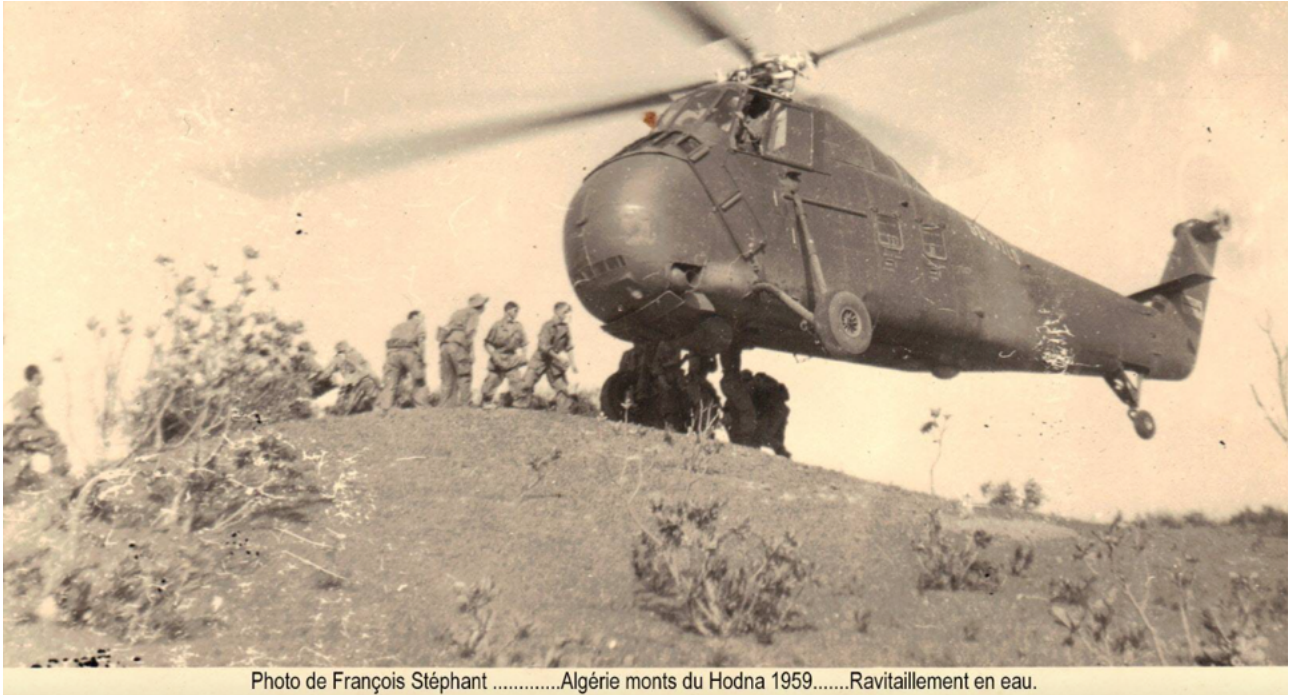
Photo de François Stéphant .....Algérie monts du Hodna 1959.....Ravitaillement en eau.

Changement d'époque et de sujet, revenons à nos Sikos. Voici deux photos qui démontrent les capacités de nos Sikos (H34 et HSS) en appui sur une seule roue même dans les zones les plus inaccessibles. Une prouesse que les pilotes de l'Armée de l'Air et de la Marine devront reproduire régulièrement au cours de leurs missions sur des terrains très escarpés.