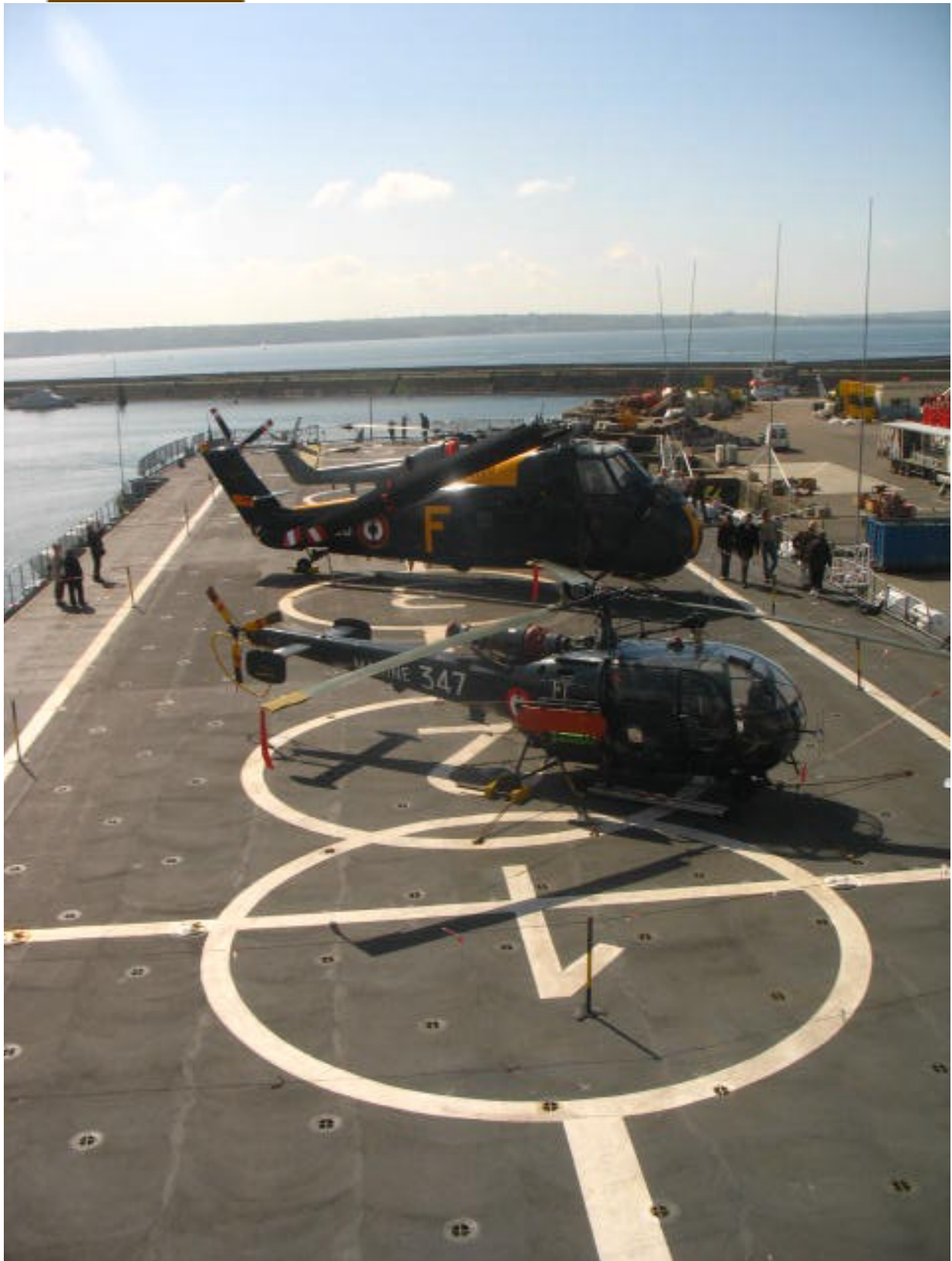
L'Alouette 347, le HSS 128 Foxtrot et le Lynx WG13 sur le pont.